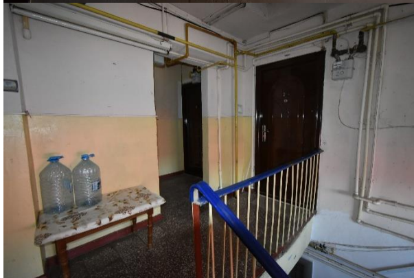
Vedere apartament subiect: