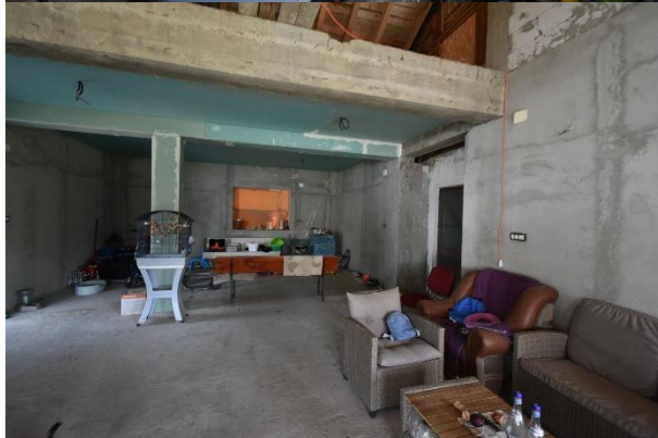
Construcție C2 intabulată: