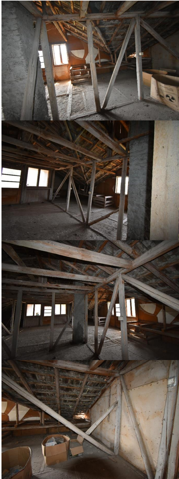
Extindere C1 neintabulată – interior și exterior: