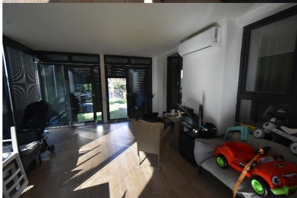
Vedere interior proprietate subiect: Parter