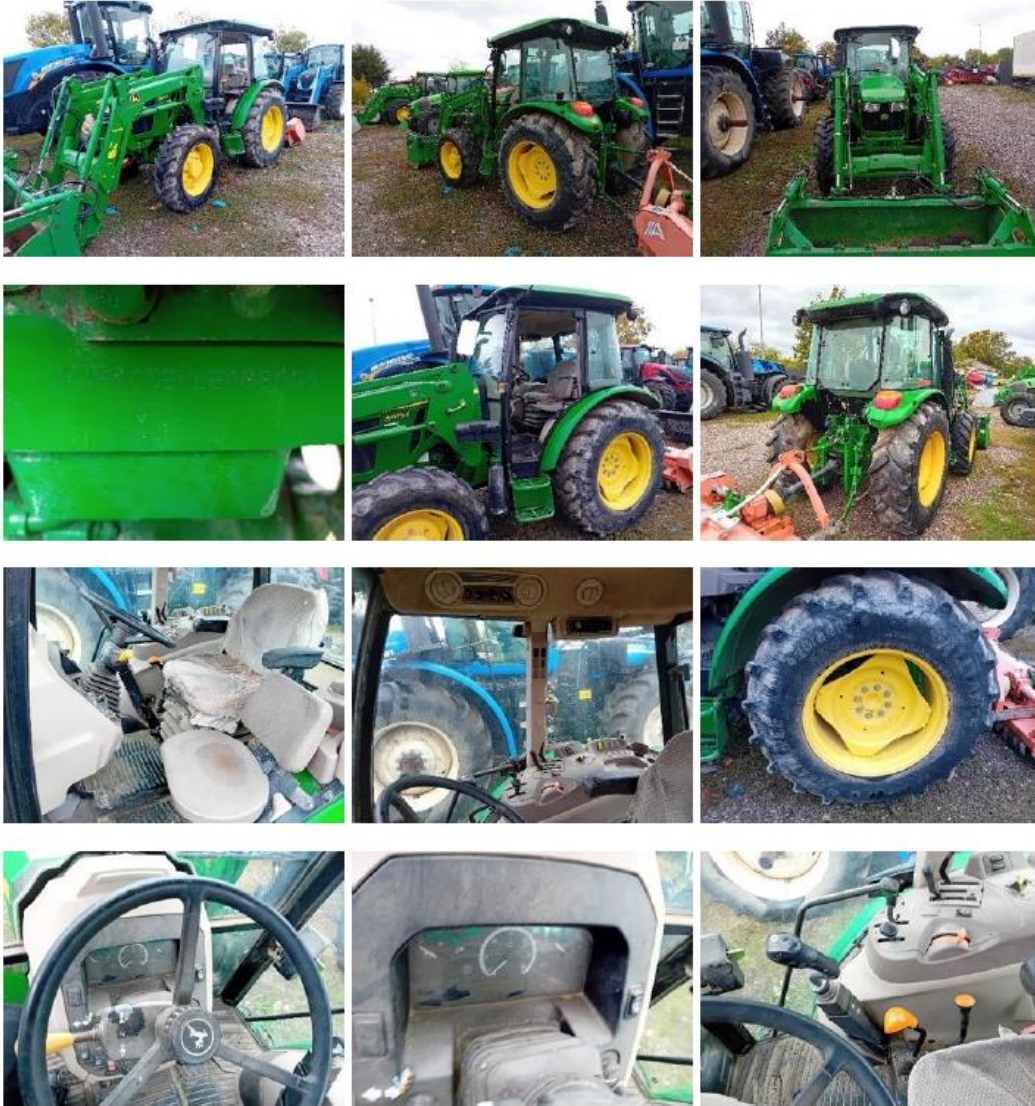
Tractor John Deere 5075E